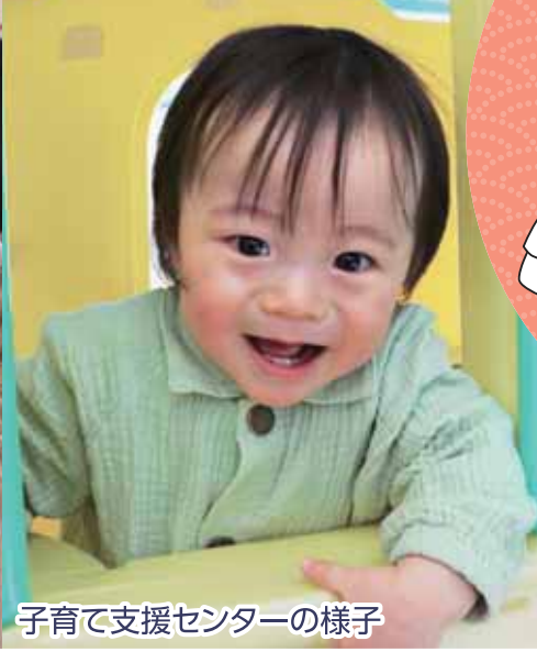
子育て支援センターの様子