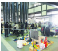
▲R2フリーマーケット