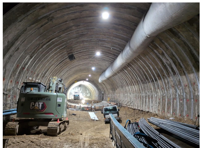
■現在の松之木町側の状況 (R8.4)

松之木千島線では、トンネルをはじめ橋梁やボックスカルバートなど、様々な工種が含まれ、なかなか経験できない著大事業です。大変なこともあります、早期完成に向け職員一同がんばっています。