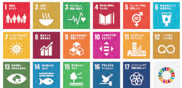
エスディーゼーズ 持続可能な開発目標「SDGs」17の目標