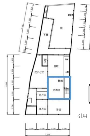
引用 高山空家活用コンテストHP

旅行中に出してしまった小銭を使用してもらったり、また朝市に行く際にお金を崩してもらい、気軽に 新たな高山の魅力を知ってもらう。