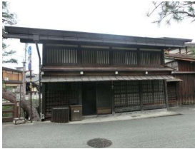
引用 高山空家活用コンテストHP

日下部民藝館、吉島家住宅などの 歴史的建造物 がある。 徒歩5分で 宮川朝市 もあり、朝から観光が楽しめる。