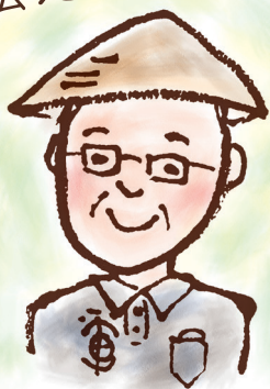
（文・絵）大森 茂樹 （画）高山市

車田の伝統を継承してだけでなく、車田史跡公園のリーフレットを作ったり、キャラクターを作って塗り絵コンテストをしたり、楽しんでもらう活動もしたるんやさ。これらの活動を支えてくれるのは、保存会の若いメンバーたち。まちづくりフォーラムの展示を見て興味を持った人が、他の地域からも参加してくれています。車田を盛り上げてくれる仲間を増やしていきたいな。