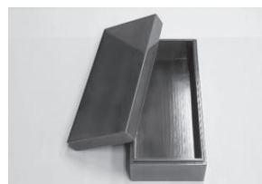
飛騨春慶 角長小箱(紅春慶)