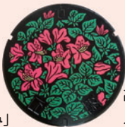
高山 「こばのみつばつじ」