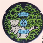
上宝・奥飛騨温泉郷 「おこじよ」