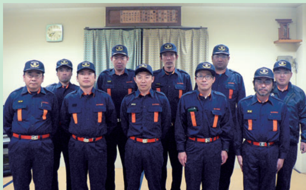
清見支団 第4分団の皆さん

今後も、各種訓練を通じて、災害対応能力の向上を図ると共に、地元自主防災組織との連携を強化し、地域住民の安全安心のため尽力してまいりますので、より一層の消防団活動へのご理解、ご協力をお願いします。