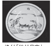
染付「竹林月夜」模様皿(安堵町蔵)