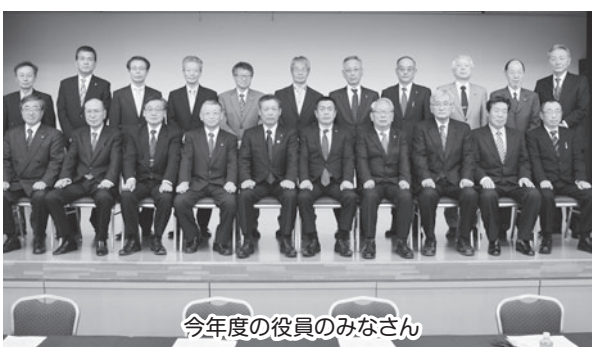
今年度の役員のみなさん