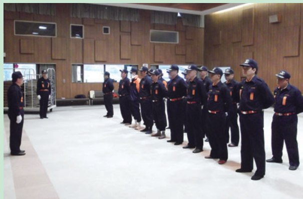
高根支団 第1分団(島田分団長)以下団員の皆さま