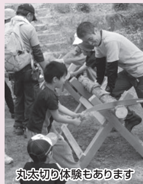
丸太切り体験もあります

6月第1日曜日は高山市の「みどりと親しむ日」であることから、松倉山市民ハイキングを行います。