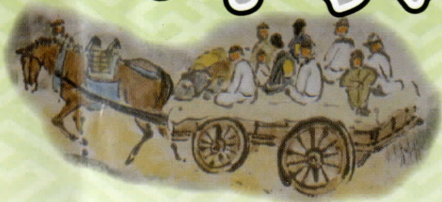
玉屋春輝「旅行道中絵巻」

Five old historical road from Hida Takayama