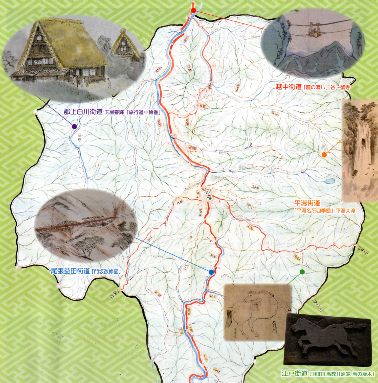
郡上白川街道 玉屋春輝「旅行道中絵巻」