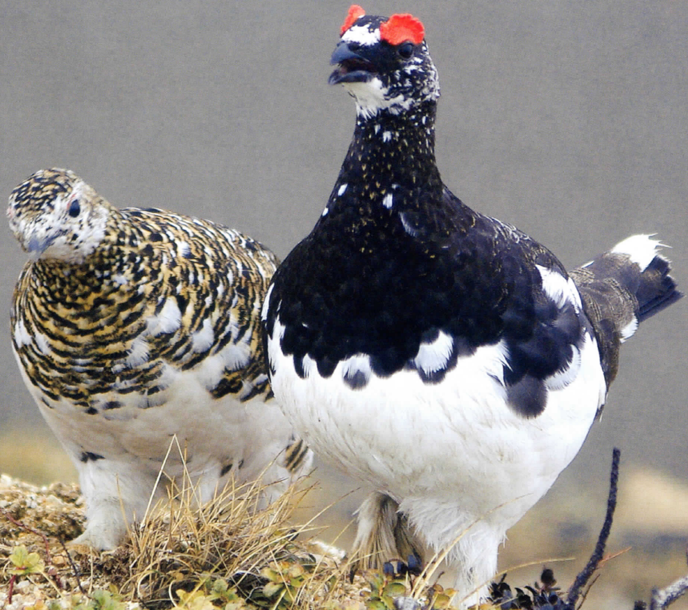
ライチョウ「番・春」