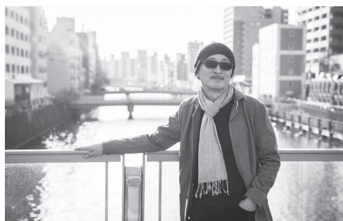
うへだ まさき 上田正樹さんプロフィール