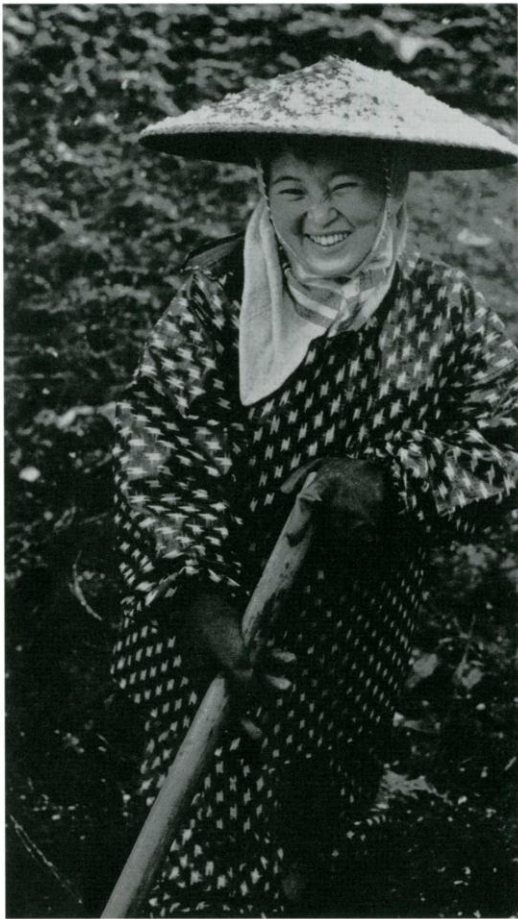
細江光洋「初雪」(部分) 岐阜県美術館蔵