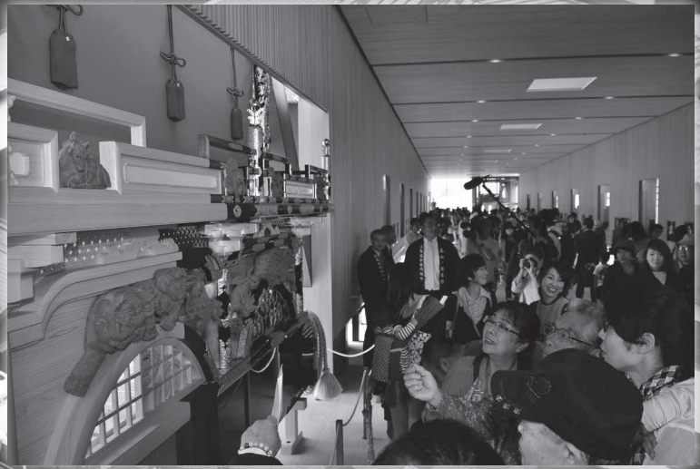
匠通り(東西自由通路)では、展示屋台の除幕式や西小学校、山王小学校の児童による屋台囃子や「めでた」の披露がありました。