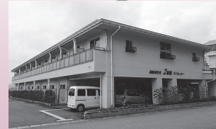
↑高齢者住宅2番館 (デイサービスセンター、サービス付き高齢者向け住宅) (新宮町)