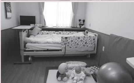
バリアフリーにも配慮された室内

「共生社会」は、誰もが相互に人格と個性を尊重し支え合い、多様な在り方を相互に認め合える全員参加型の社会で