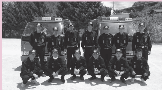
清見支団第3分団 鷺見分団長以下団員のみなさま