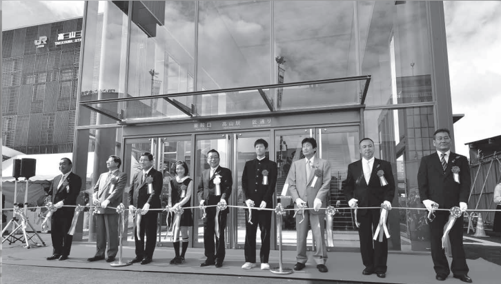
乗鞍口(東口)では、完成式典の後、テープカットや中山中学校吹奏楽部による演奏が行われました。