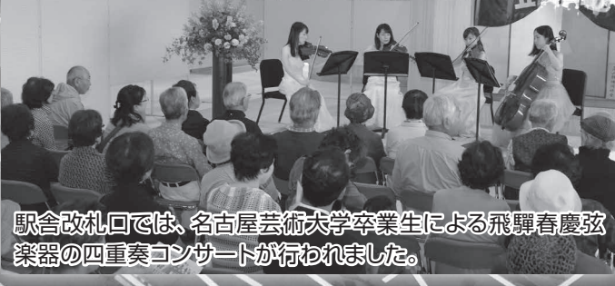
駅舎改札口では、名古屋芸術大学卒業生による飛騨春慶弦楽器の四重奏コンサートが行われました。