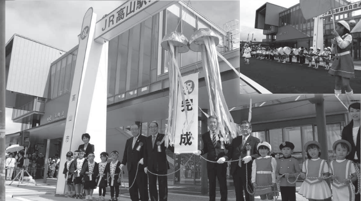
白山口(西口)では、物産展などが行われたほか、市内園児の鼓隊や踊り、和太鼓の演奏が行われ、完成をお祝いしていただきました。