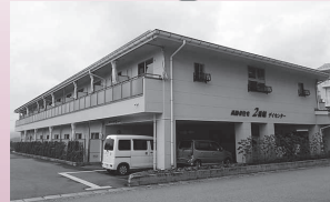
↑高齢者住宅2番館 (デイサービスセンター、サービス付き高齢者向け住宅) (新宮町)