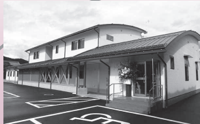
ナッシングデイ高山↑ (療養通所介護施設) (冬頭町)