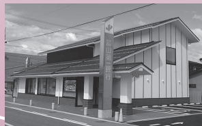
富山第一銀行 高山支店→ (銀行) (昭和町1)