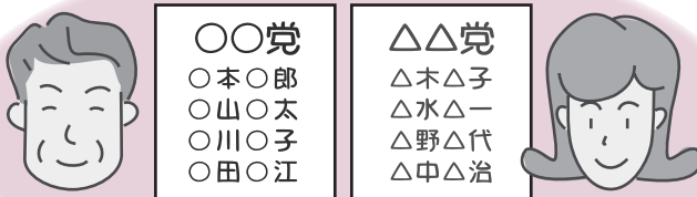
各政党が候補者名簿を提出（当選順位はなし）