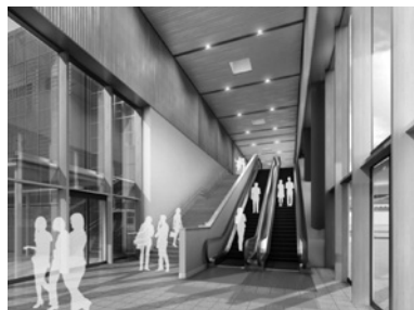
自由通路(イメージ)

とその理由、住所、氏名（ふりがな）、年齢、電話番号を記入のうえ、12月31日(休)までに窓口・郵送・FAX・MAIL