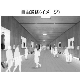
自由通路(イメージ)