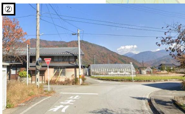
区画線再設置による道路の優先関係の明確化