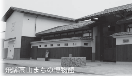
飛騨高山まちの博物館