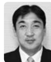
山腰 恵一 議員

http://www.city.takayama.lg.jp/gikai/gikai-eizou.html