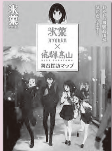
アニメ「氷菓」をテーマとした周遊観光の案内

委員会ではスマホを活用した観光・地場産品・店舗などの情報取得について高山にふさわしいシステムを研究すること、またコンテンツの開発・活用・周知についても、民間力を活用しつつ推進することを提言に付加しました。