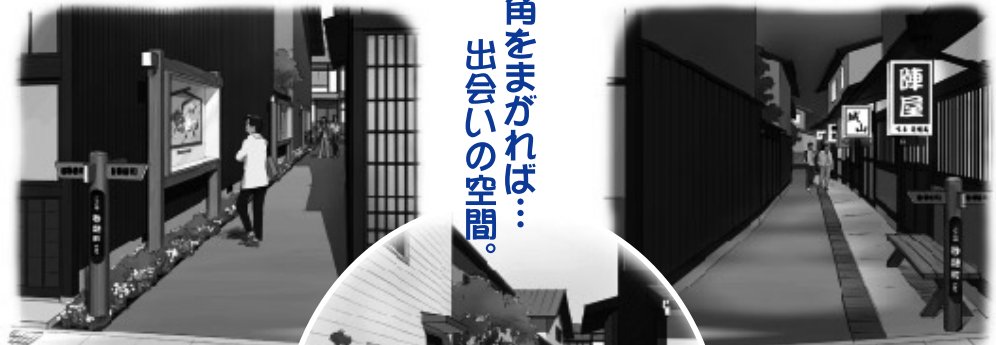
「個性の強化・創出」を目指した整備例 (歴史的資源活用型)