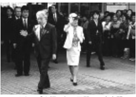
にこやかに手を振られる両殿下(高山駅で)

常陸宮殿下・華子妃殿下が御来高 全国和牛能力共進会の開会式ご臨席のため御来高された常陸宮殿下・華子妃殿下は、屋台会館や特別養護老人ホーム新宮園などをご視察されました。