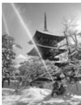
国分寺での訓練 (昨年)