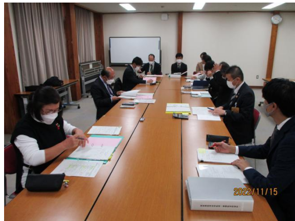
書類監査 (桜の郷荘川)