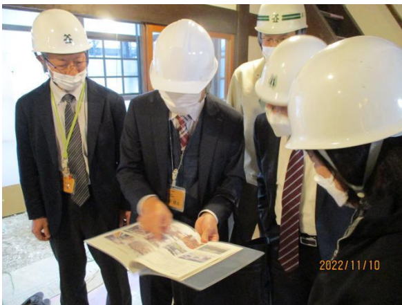
施設現地監査 (市政記念館)