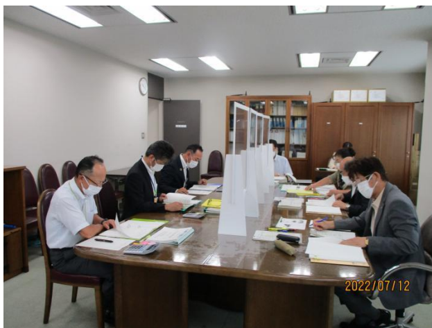
書類監査 （監査委員室）