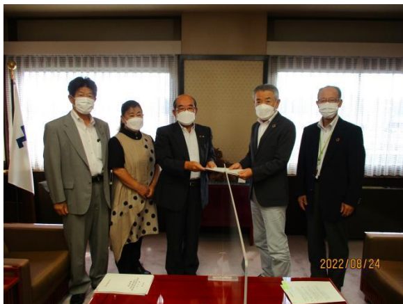
監査結果（決算審査 意見書）の提出