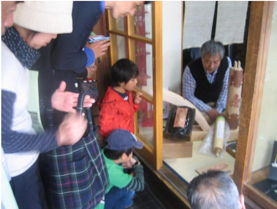
不破鋳工房(飾り金具)の見学