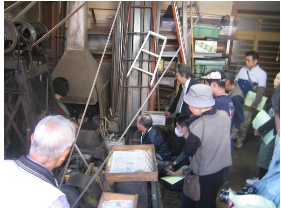
新名鍛冶屋(鉄金具)の見学