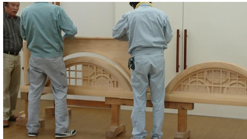
実物大展示屋臺の組み立て作業(平成28年5月)