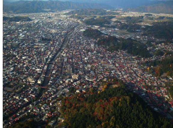
高山市街地(中央が宮川 城下町は宮川の右側)

そこで、「地域における歴史的風致の維持及び向上に関する法律」に定める「歴史的風致（良好な市街地環境）の維持及び向上」を進める本計画を策定し、地域活性化を推進することを目的とする。