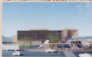
風の駅舎イメージ

自由通路東口前に、駅前広場の象徴的な場所となる空間「回廊広場」を整備します。 観光案内所やシンボルツリーベンチの他、地下水を利用した水盤(水深最大5cm程度)を整備して訪れる人を迎えます。