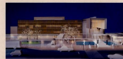
夜の駅舎イメージ

高山格子からこもれ出る雰囲気など、演出照明を使って高山独特の夜の雰囲気をつくります。