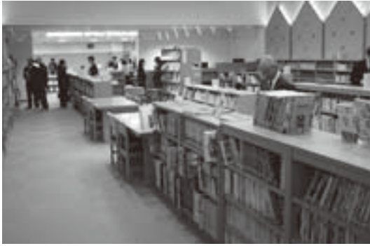
図書館はワンフロアの広々空間です。みなさんぜひご利用ください