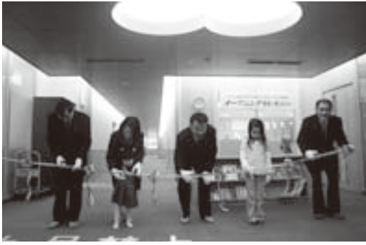
テープカットする関係者のみなさん