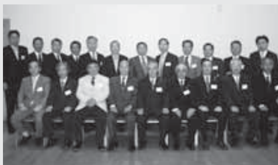
今年度の役員のみなさん