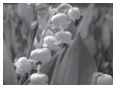
可憐なすずらんがお出迎え