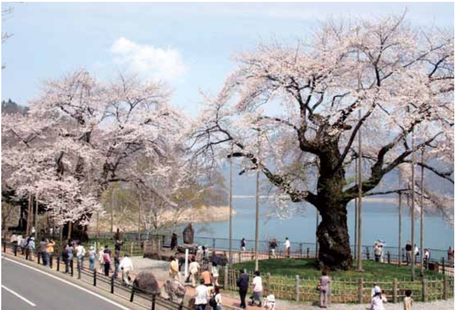
湖底に沈んだふるさを偲 しの び 咲き誇る莊川桜 (ひだ莊川桜まつり 4月28日撮影・莊川地域)