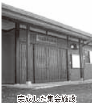
完成した集会所施設