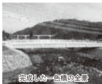
完成した一色橋の全景

工事期間中は、全面通行止めになり利用者のみみなさんにご不便をおかけしました。ご協力ありがとうございました。