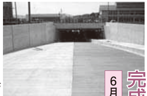
国分寺通り側から望むJRアンダーパス

平成18年度から進めていたJRアンダーパス工事がいよいよ完成し、6月27日(土)午後1時からご利用いただけるようになります。