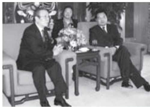
王君正市長(右)と会談する土野市長