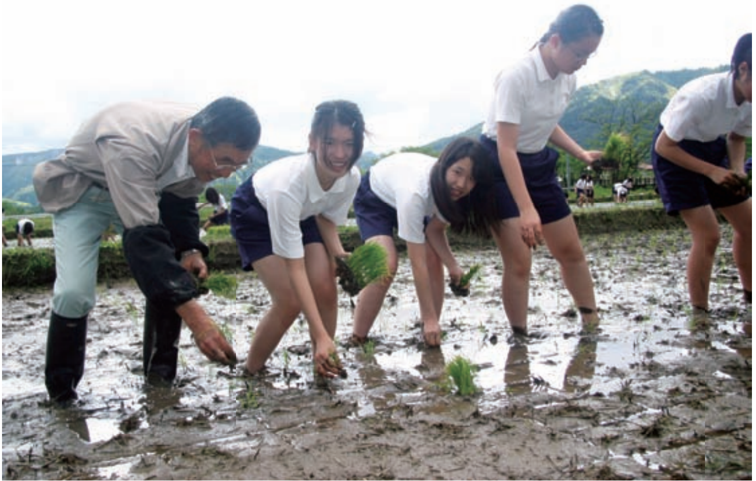
昔ながらの田植えに都会っ子歓声 (ふるさと体験飛騨高山で教育旅行受入れ) 5月13日撮影・一之宮地域