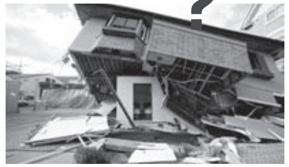
中央の白い工作物が耐震シェルター

住まいの「災害時要援護者」を対象として、地震時に家屋の倒壊から身を守り、安全な空間を確保するための「耐震シェルター」の設置費用の補助制度を創設しました。