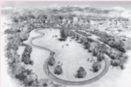
陸上競技フィールドが収まるほどの広さです

都市整備課 ☎35-3176 FAX35-3168 toshiseibi@city.takayama.lg.jp