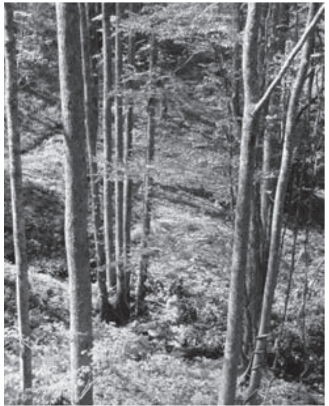
乗鞍山麓五色ヶ原の森

もし、大気中に温室効果ガスが全くなかったら、地球上の気温は平均で約マイナス18℃となってしまうと言われていました。温室効果ガスのおかげで、地球上は人間や動植物が生きていくためにちょうど良い気温に保たれているのです。