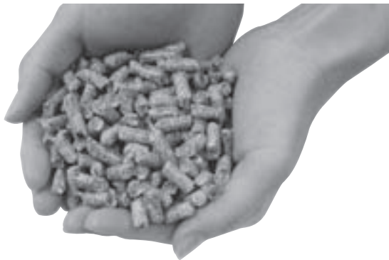
バイオマス燃料の一つであるペレット燃料。ペレットとは英語で「小さい塊」の意。間伐材や木くずなどを小さく固めて作ります

バイオマスとは、もともと生物 (bio) の量 (mass) のことで、エネルギー源や原料として使うことができる、再生可能な生物由来の動植物資源 (化石燃料は除く) の総称です。