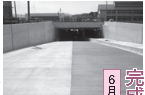
国分寺通り側から望むJRアンダーパス

平成18年度から進めていたJRアンダーパス工事がいよいよ完成し、6月27日(土)午後1時からご利用いただけるようになります。