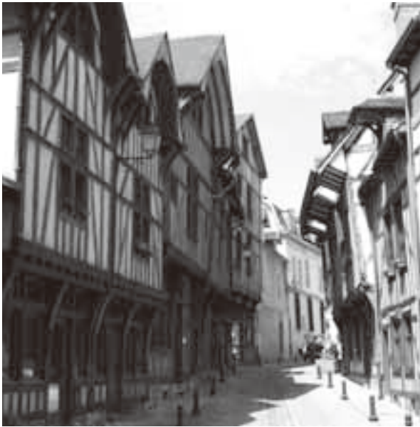
伝統的な木骨組み建築の町並み

今号では、高山市の工芸作家の作品展を支援したり、高山市との友好交流を始めたトロワ市の情報収集にあたるなど幅広く活動しているフランス派遣職員からトロワ市についてのレポートをご紹介します。