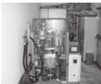
BDFへの再生する装置。燃料は公用車に利用されています

市では現在、家庭から排出される「廃食油」をゴミとして出す場合、液体のままでは処理することができないため、布や紙に染み込ませるか、あるいは固化剤で固めて可燃ゴミとして出している。ただ、市民のみならず、今回の取り組みは、ごみの