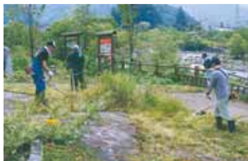
町内会総出の草刈り作業

奥飛驒温泉郷を訪れる多くの観光客の方に、きれいな環境で美しい自然に親しんでいただけるよう町内会全員でよりよい地域づくり