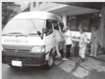
支所地域の大切な交通手段として利用されている福祉バス

●アンケート調査期間 8月上旬～下旬 問合せ先 高山市公共交通活性化協議会(事務局) 企画課 ☎35-3131