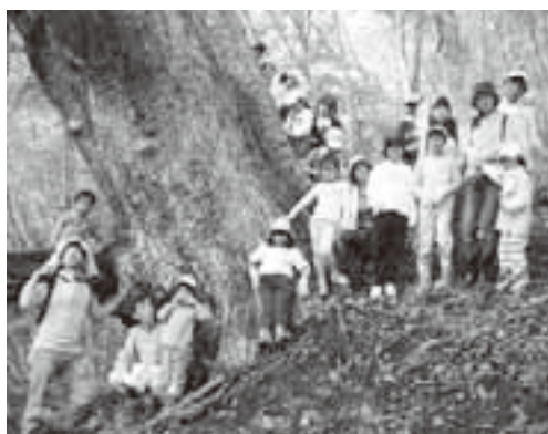
土曜教室での原生林体験ツアー(清見社教)