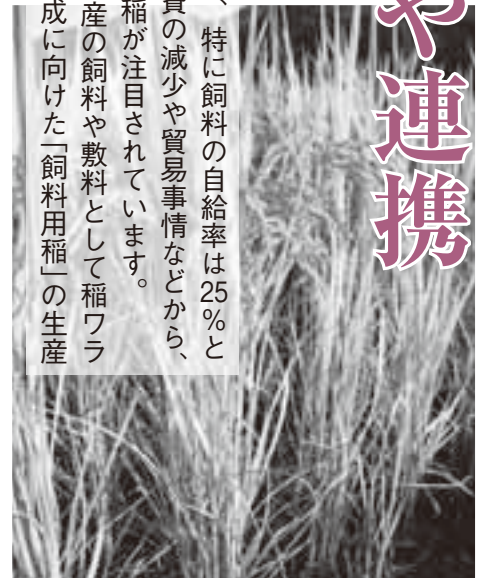
外観は食用米と変わらない飼料用米

日本の食料自給率は先進国の中で最も低く、特に飼料の自給率は25%と低い状況にあります。一方、稲作では、米消費の減少や貿易事情などから、生産調整（減反）が実施され、転作での飼料用稲が注目されています。こうした状況を踏まえて、高山市では、畜産の飼料や敷料として稲ワラを有効活用する窓口の設置や米の生産調整達成に向けた「飼料用稲」の生産奨励への取組みを始めました。