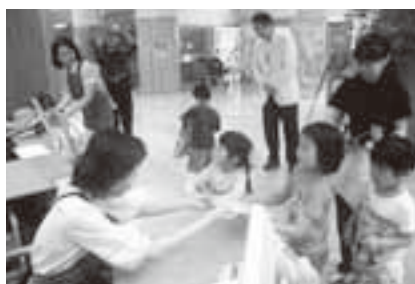
本の借り方が分かったよ! (自分で本を借りる園児たち)

初めに、紙芝居を鑑賞し、館内を「走らない・大声を出さない」など、図書館利用のマナーを司書職員と約束した園児は、絵本コーナーに移動。それぞれ好きな本を1冊選び、自分で貸出カウンターで本を借りました。