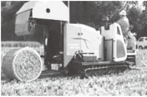
稲発酵粗飼料は、ロール状にして収穫します

市内での稲ワラの利用は、田に打ち込む「すきこみ」がほとんどで、はさ掛けの稲ワラの約4割・70分がすきこみされている状況となっています。（市調べ）