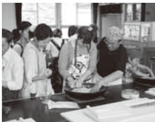
そば打ち教室(新宮社教)