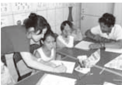
シビウの子どもたちとの交流の様子