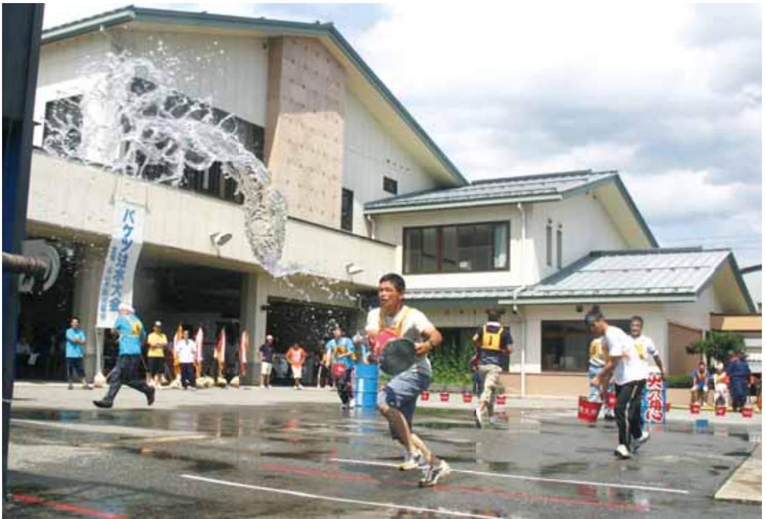
伝統のバケツ注水健在 (第55回バケツ注水大会開催) 7月15日撮影・高山消防署