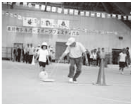
スポーツフェスティバル(荘川社教)