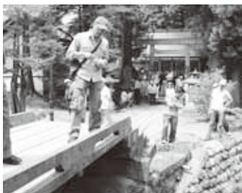
歴史探訪江名子川橋めぐり(東社教)