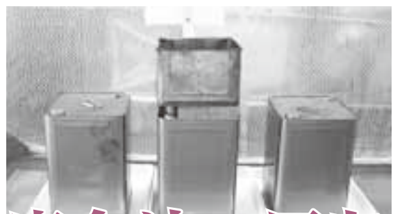
廃食油を回収する18リットル缶