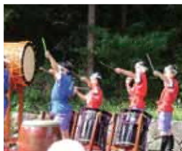
子どもたちによる「栃っ子たから太鼓」

地域の方から直接教えてもらう場合は、地域の方々の生き方とつながる場でもあります。子どもたちが身につけた演奏は学校活動にとどまらず、地域の行事にも定期的に出演することによって、伝統