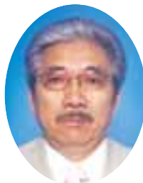
はばした 端下 ただし 忠さん

奥飛驒温泉郷地区連合町内会は、高原川の左右、モズモ川沿い、蒲田川沿いにある9つの町内会で構成しています。昨年までは12の町内会がありました。今年3月に4つの町内会が合併しました。