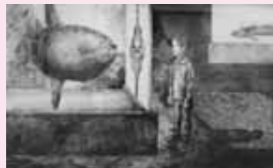
昨年度市展賞受賞作品(一般・版画部門)