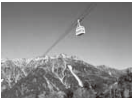
新穂高ロープウェイ