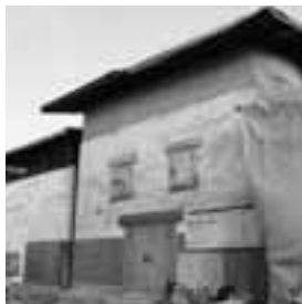
現存する旧矢嶋邸の土蔵