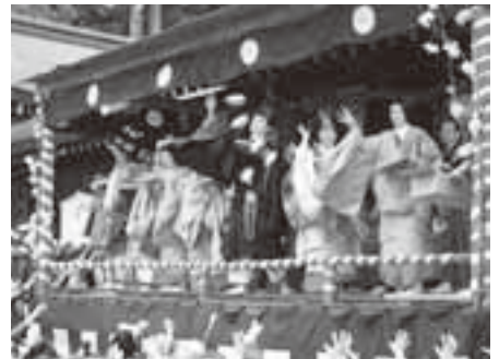
飛騨生きびな祭り