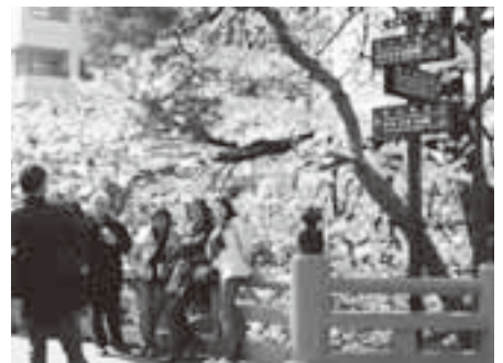
多言語看板と外国人観光客

ふるさと納税制度の開始にあたって、高山市では1億円の「飛騨高山ふるさと基金」を創設しました。この基金は、高山市を応援していただけるみなさんからのご寄附と合わせ、高山市も同額を積み立てることにより、寄附者と市、市民が一緒になってまちづくりを進めていくものです。