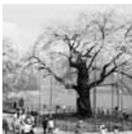
御母衣ダム湖畔の荘川桜