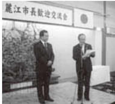
麗江市長歓迎交流会では、市民のみなさんに寄附していただいた図書472冊を寄贈しました。ご協力ありがとうございました