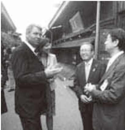
土野市長の案内で古い町並を散策するクラウス・ヨハニス市長⑤