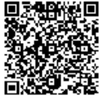
防災情報提供センターのQRコード。ご利用ください

5月27日(木)午後1時から、岐阜地方気象台発表の大雨などの気象警報・注意報が市町村ごとの発表に変更となり、これまでの「飛騨北部」は、高山市・飛騨市・白川村として発表され、お住まいの地域が警戒の対象となっているかどうかのわかりやすくなります。