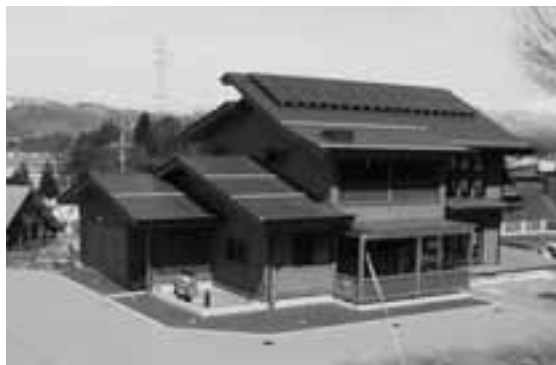
環境負荷の少ない暮らしを提案するエコハウス

市民のみなさんにエコハウスのメリットを直接体験していただける施設として4月17日、「飛驒高山・森のエコハウス」がオープンしました。 この住宅は高山市の豊かな森林資源を活かすため建築資材や暖房用エネルギー源として木材を最大限に活用していることが特徴。その他にも数多くのエコ機能を提案しています。ぜひ体験してください。当面の開館日は土、日曜日(午前10時〜午後4時)を予定しています(飛驒の里第2駐車場)。