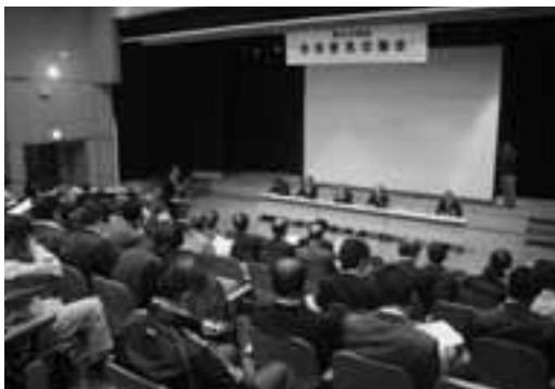
朝日地区での市民意見交換会

すべての地域の市民意見交換会が終了した後は、議会改革などについて全議員で討議する政策討論会を行い、みなさんからいただいた貴重なご意見を議会活動や市政に反映できるように検討を重ねていきます。