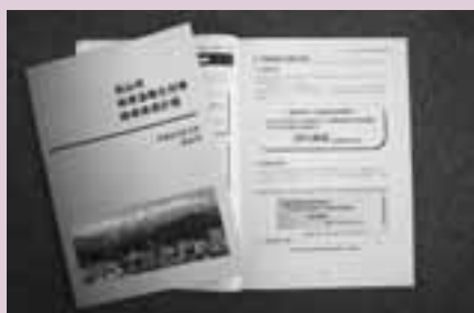
地球温暖化対策地域推進計画