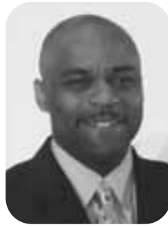
デンバー市議会議員 マイケル・ ハンコックさん

両市は半世紀にわたり幅広い分野で活発な交流を行いながら友好関係を深めてきました。関係者の皆様方や両市民のこれまでのご尽力に対して心からお礼申し上げますとともに、この50周年を契機として両市の姉妹都市関係を一層深めるため、さまざまな分野で協力して取り組んでまいります。皆様のご理解とご協力をお願い申し上げます。