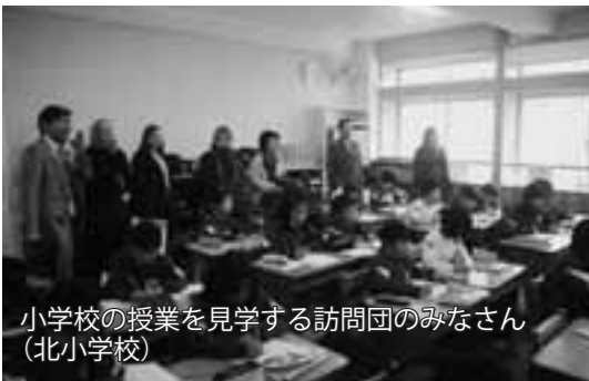
小学校の授業を見学する訪問団のみなさん (北小学校)