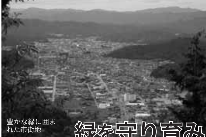
豊かな緑に囲まれた市街地