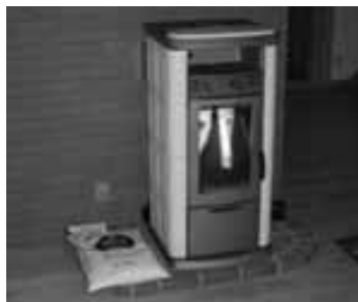
エコハウスに設置されているペレットストーブ