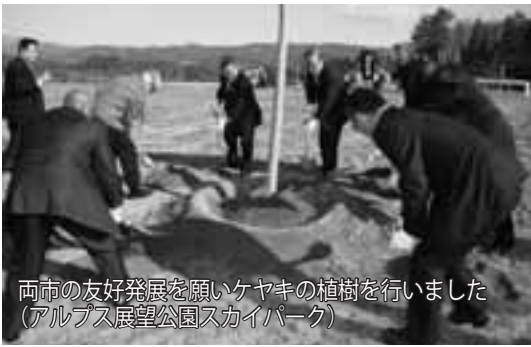
両市の友好発展を願いケヤキの植樹を行いました (アルプス展望公園スカイパーク)