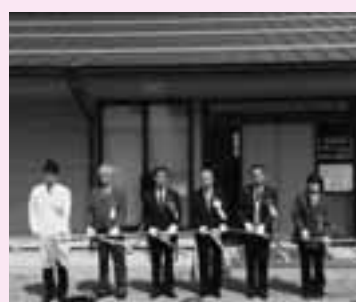
完成した施設の前でテープカット

これまでの施設は昭和43年の建設以来、老朽化が激しかったことから旧荘川支所の跡地に整備したもので、新しい施設は木造平屋建て延べ198平方メートル、診察室、処置室、X線撮影室、待合室などを配備しています。