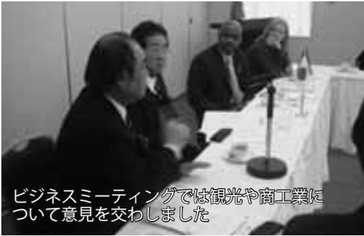
ビジネスミーティングでは観光や商工業に ついて意見を交わしました