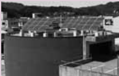
歩道照明灯に太陽光発電を導入。市の施設として初めて整備しました。

市では、CO 2 (二酸化炭素)の排出抑制と省エネに有効な太陽光発電とLED(発光ダイオード)照明をモデル的に整備しました。市役所庁舎横にある市営花岡駐車場屋上に設置した太陽光パネルからは、庁舎周辺の10基のLED照明に給電。また、法務局前交差点からJRアンダーパスまでの歩道には、1基ごとに太陽光パネルを持つLED照明灯を20基設置しました。日暮れから夜明けまで点灯しています。●問合せ先 維持課 ☎35-3340