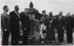
初のデンバーへの訪問団(昭和39年)