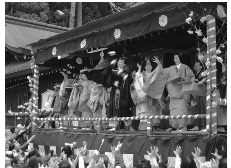
飛騨生きびな祭り