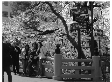
多言語看板と外国人観光客

ふるさと納税制度の開始にあたって、高山市では1億円の「飛騨高山ふるさと基金」を創設しています。この基金は、高山市を応援していただけるみなさんからのご寄附と合わせ、高山市も同額を積み立てることにより、寄附者と市、市民が一緒になってまちづくりをすすめていくものです。