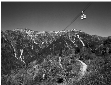
新穂高ロープウェイ