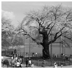
御母衣ダム湖畔の荘川桜