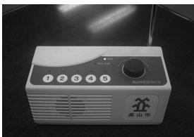
緊急地震速報受信機 (ラジオ型)