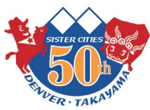
高山市・デンバー市 姉妹都市提携50周年記念ロゴマーク

ふるさと納税で 飛騨高山を 応援してください いただいた寄附金は、 魅力ある高山のまちづくりに 活かします。 (問合せ先 企画課 ☎35-3131)