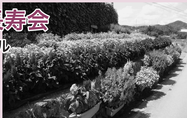
金賞を受賞した山口町長寿会の花壇