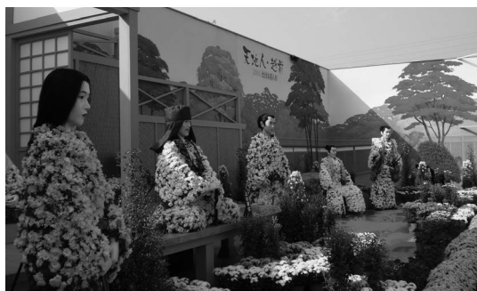
2009たけふ菊人形のテーマ「天地人・越前」