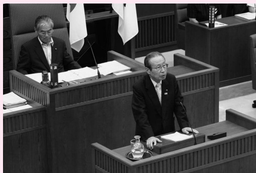
市議会定例会で任期を振り返る土野前市長

尽くせたことが最大の喜び」と述べ、「16年間病気もせず市長を務めることができ、本当にありがたかった」と、最後のあいさつをしました。