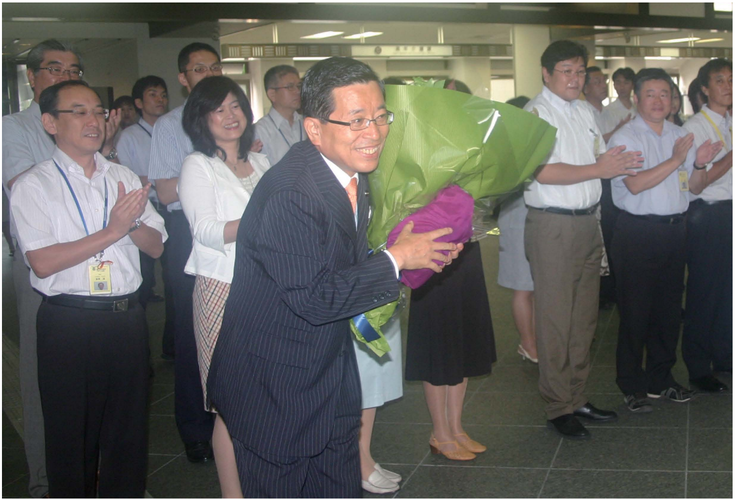
國島市政がスタート くしまちひろ 初登庁した國島芳明市長 (9月6日撮影・高山市役所)