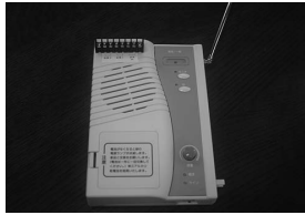
緊急地震速報受信機 (館内放送接続型)