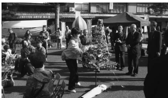
キャンペーンのようす(陣屋前広場)

また翌3日は、高山陣屋前広場において「飛騨地域子ども虐待防止キャンペーン」が開催されました。会場では、詰め掛けた人が会場内に設置されたツリーに、虐待防止を呼びかけるメッセージカードを結んでいる姿が見られました。