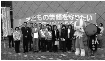
伝達式のようす(市役所)

11月の児童虐待防止推進月間に合わせ、県内では児童虐待防止運動が行われています。その取り組みをPRする「ぎふオレンジリボン・キャラバン隊」が11月2日、市役所を訪れ、知事メッセージを読み上げる伝達式が行われました。