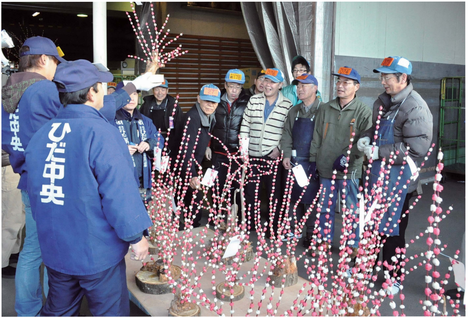
市場を彩る紅白の正月飾り 公設地方卸売市場で師走恒例の「花もち市」 (12月9日撮影・高山地域)