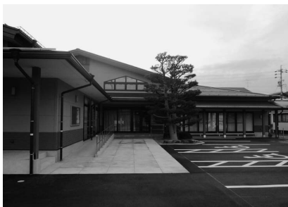
完成した集会所施設