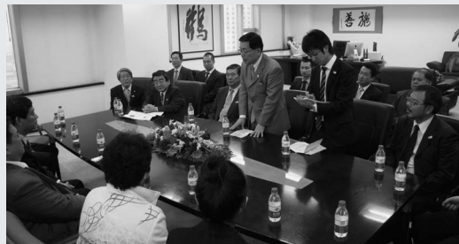
大連市の家具協会関係者に飛驒家具をPRする國島市長