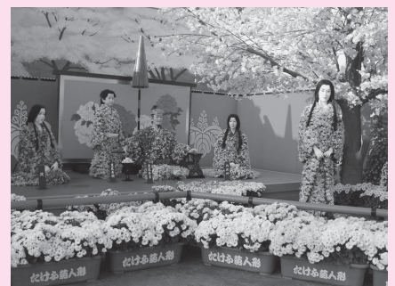
菊人形展のようす