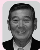
旭日小綬章 (地方自治功労)