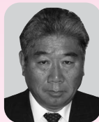
瑞宝双光章(消防功労)