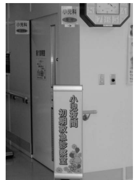
小児夜間初期救急診療支援室 毎週金午後8時～9時30分まで受付

今後も引き続きこの支援施設を含め、救急医療の適正利用にご理解とご協力をお願いします。