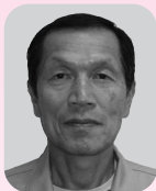
瑞宝単光章(防衛功労)