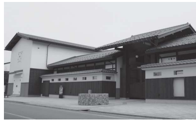
飛驒高山まちの博物館

1家族1枚まで。1枚の券で家族単位の入館が可能。配布時に住所、氏名を確認させていただきます。