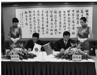
高山市/昆明市間の友好交流推進に向けた覚書を交わす両市長(平成23年7月4日)

中国南西部の雲南省の省都で、三方を山に囲まれた海拔約1900mの高原に位置し、人口約730万人を擁する同省の政治、経済、文化、交通の中心地です。漢族のほか、イ族、白族など23もの少数民族が居住しています。