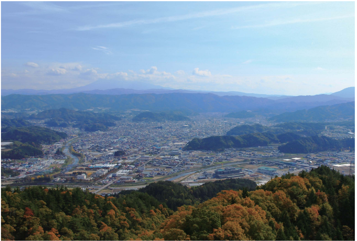
秋晴れの高山市街地 (11月2日撮影・高山地域)