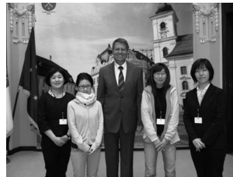
クラウス・ヨハニスシビウ市長を表敬訪問するボランティア参加者(平成22年5月20日)

シビウ市は、平成19年に欧州文化首都に選定されるなど、文化事業に力を入れており、そのノウハウを学ぶことで、高山市の「文化力」向上に繋げて行くことを目指します。