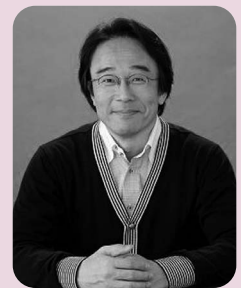
内多勝康アナウンサー

※入場整理券は市役所1階インフォメーション、市民文化会館、各支所にて11月15日(火)から配布します。