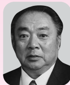
瑞宝単光章 (電気施設保全業務功労)