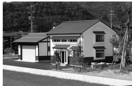
北日本物産(株)高山営業所