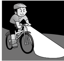
夜間はライトを点灯

～5月は自転車の安全利用推進月間です～ 正しいルールを知り、安全に自転車を利用しましょう!