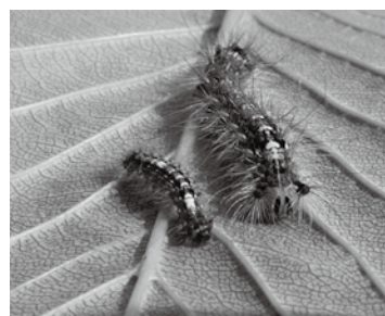
幼虫の写真▲

作業時に、幼虫の体毛に触れることで痛みやかぶれを起こすことがあるため、卵の駆除時と同様、マスクやゴーグル、軍手を着用しましょう。ふ化直後の幼虫は市販の殺虫剤（毛虫駆除用）で駆除することができます。