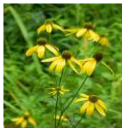
オオハンゴンソウ