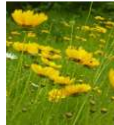
オオキンケイギク