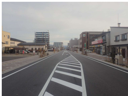
国道158号側から望む

当路線は、高山駅周辺の駅東地区に位置する幹線道路です。自転車歩行者道の整備や右折車線の設置により快適な道路環境整備を行うとともに、無電柱化による良好な景観形成や地震時の電柱倒壊による道路閉塞の防止など防災機能の強化が図られました。