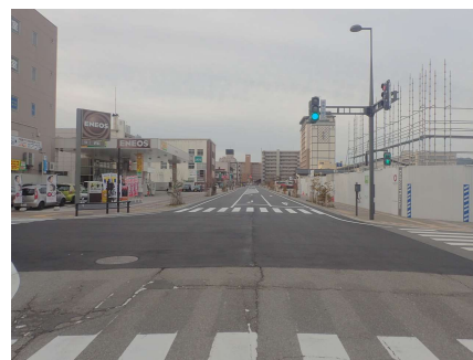
高山駅側から望む