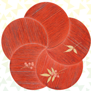
「春慶塗 割目梅形菓子盆」

飛騨高山まちの博物館では、郷土の貴重な歴史資料の散逸を防ぐとともに、飛騨の歴史・文化について多くの方に知っていただくために、寄付の受入や購入による資料の収集を行っています。今回の特別展では、新たに収集した資料の中から、暮らしに彩りを添えてきた品々を紹介致します。飛騨高山の地に今も息づく歴史・文化の一端を、ぜひご覧ください。