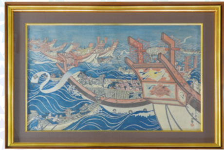
「蒙古襲来合戦大版画」 守 洞春