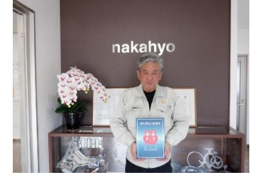
(株)ナカヒョウ飛驒工場